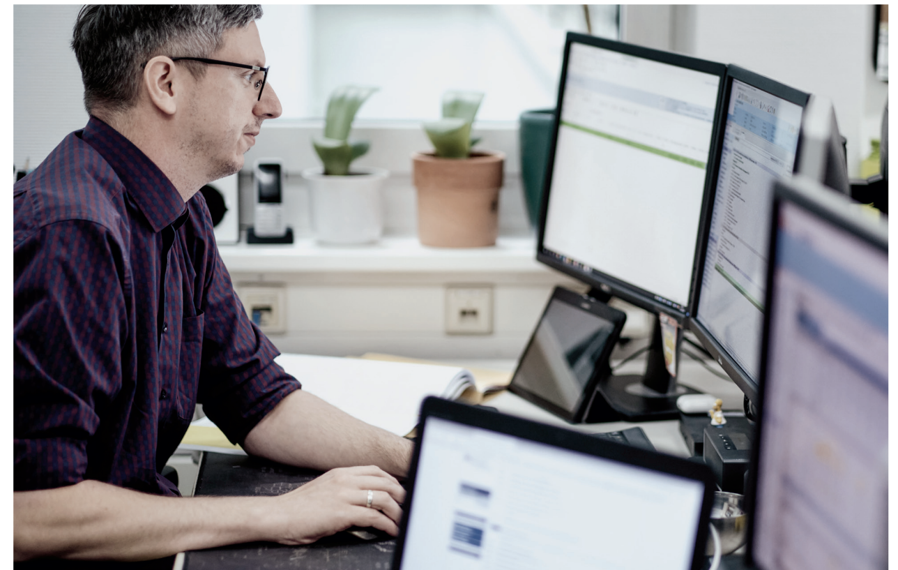
5. Die Klinik-Abläufe bleiben unverändert. Der Codierer erstellt wie gewohnt die Codes für den regulären Entlassbrief. Die Patientenbrief-Software greift auf diese Daten zu und erzeugt komplett automatisch den leicht verständlichen Patientenbrief.