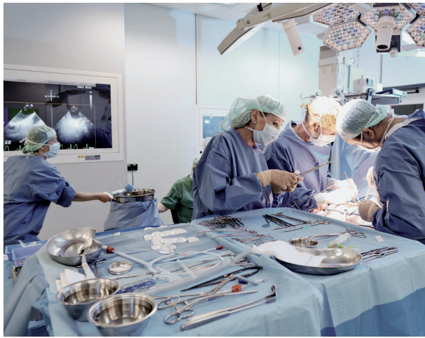
1. Eine Operation am Herzzentrum Dresden: Technik und Können arbeiten Hand-in-Hand im Einsatz für den Patienten.