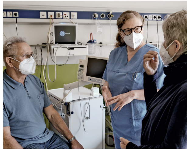
2. Ein letztes Gespräch mit der Ärztin: Dem Patienten geht es nach der OP gut – der Entlassung aus dem Krankenhaus steht nichts im Weg.