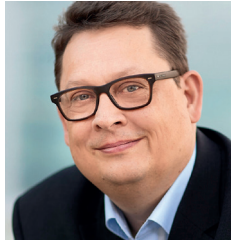
Stefan Schwartz, MdB Beauftragter der Bundesregierung für die Belange der Patientinnen und Patienten