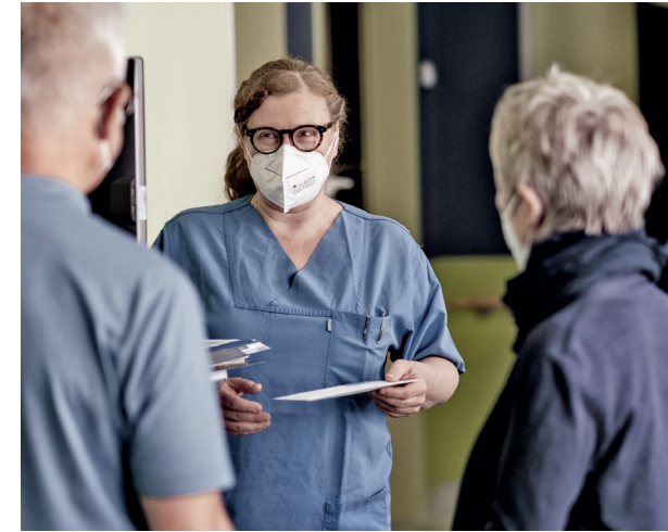
3. Der Patient erhält den »normalen« ärztlichen Entlassbrief. Trotz guten ärztlichen Gesprächs: Patient:innen benötigen nachlesbare Erläuterungen, der Arztbrief ist für sie nicht verständlich.