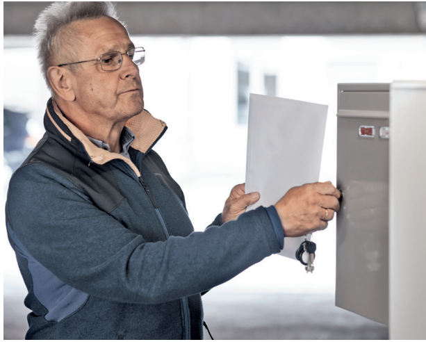
6. Mehr Wertigkeit per Post: Das Herzzentrum Dresden versendet die gedruckte Version des Patientenbriefs als ein Dokument zum Aufbewahren.