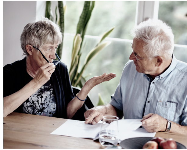
7. Gemeinsam lesen und verstehen: In der Studie des Preisträgerprojekts fanden 93 Prozent der Teilnehmenden den Patientenbrief hilfreich, die Chance auf eine gesteigerte Gesundheitskompetenz erhöhte sich um 67 Prozent.

»Eine Grundprämisse war, eine Lösung zu finden, die ohne zusätzlichen Zeitaufwand in der Klinik funktioniert.«