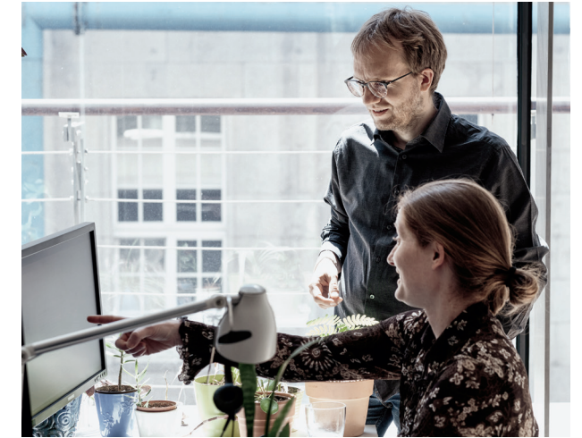
4. Jede Krankheit, jede Behandlung ist mit einem Code hinterlegt. Die Ärzt:innen von »Was hab' ich?« haben für die sog. ICD- und OPS-Codes tausende leicht verständliche Erklärungen in Form von Textbausteinen erstellt.